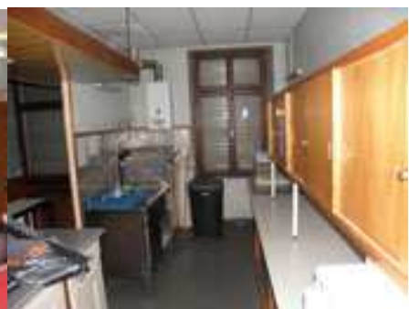
Bar (1 réfrigérateur / 1 lave vaisselle)