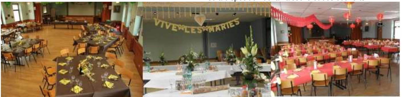
Anniversaire, mariage, fête de famille, .....