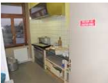
Cuisine (1 réfrigérateur / 1 congélateur / 1 évier / rangement vaisselle / 1 cuisinière avec four)